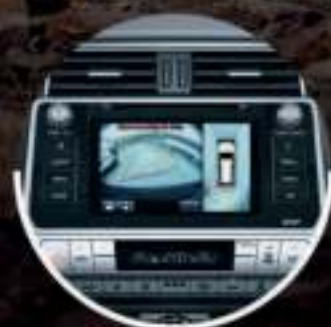
MULTI TERRAIN SELECT* (4 CÁMARAS)