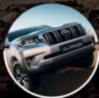
SISTEMA CRAWL CONTROL*

SI ERES AMANTE DEL OFF ROAD TAMBIÉN CUENTAS CON ESTAS OPCIONES: